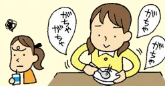
食器の音を立てる