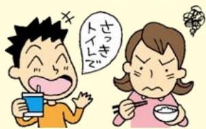
食事中にふさわしくないことを話す