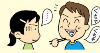
口に食べ物が入ったまま話す