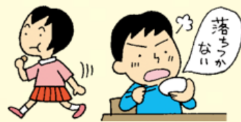
食事中に勝手に席を立つ