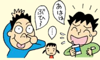
ふざけながら食べる