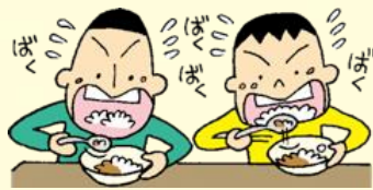
早食い競争をする