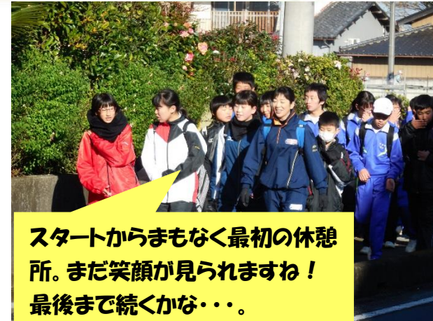
スタートからまもなく最初の休憩所。まだ笑顔が見られますね！最後まで続くかな...