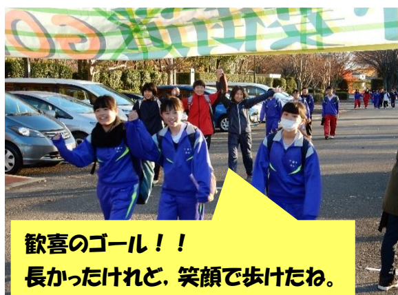
歓喜のゴール！！ 長かったけれど、笑顔で歩けたね。