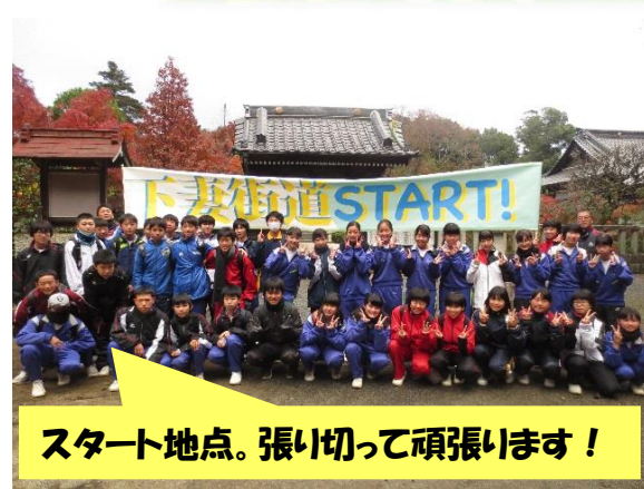
スタート地点。張り切って頑張ります！

8回目の引き落としを 12月5日(火) に行います。給食費、旅行積立で 9,233円 です。通帳の残高をご確認いただきますようお願いいたします。