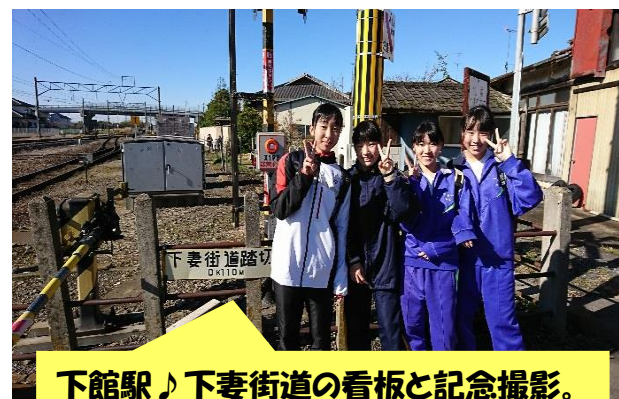
下館駅♪下妻街道の看板と記念撮影。