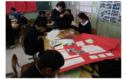
「チャレンジショップまとめ」