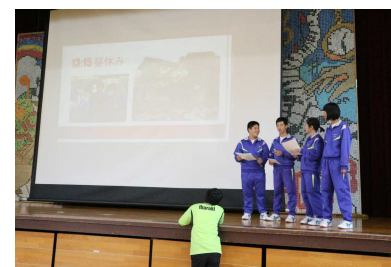
「入学説明会発表練習」

12月8日(金)の入学説明会、そして14日の総合的な学習の時間発表会に向けて、今、準備をしています。入学説明会では、各クラスの学級委員が中心となり、来年度入学してくる新1年生に向けての発表の準備をしています。また、総合的な学習の時間発表会では、4月から頑張ってきたチャレンジショップの集大成としての発表用掲示物を制作しています。総合的な学習の時間発表会へのたくさんの保護者の方のご来場をお待ちしております。