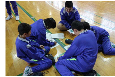
「入学説明会打合わせ」