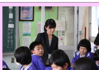
3年2組 学級活動 「こんな自分になりたい！」