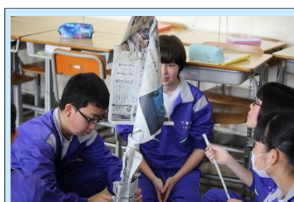
3年3組 学級活動 「新聞紙タワーを作ろう！」