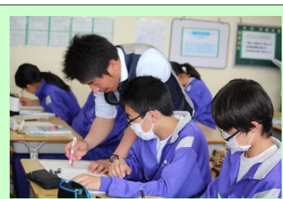
3年1組 数学 「多項式の乗法と除法」