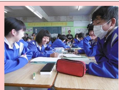
3年4組 国語 「登場人物に注目して作品を読もう」