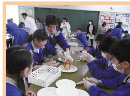
3年6組 理科 「身近なScience！」