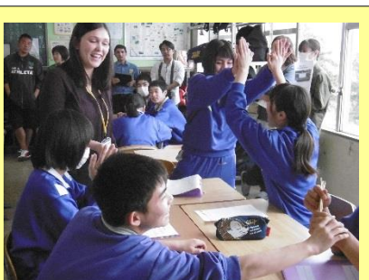
3年5組 英語 「Close to me！」