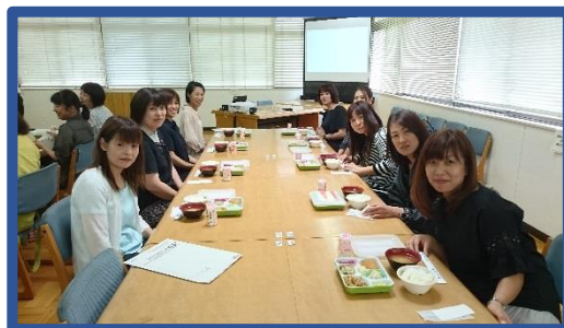
高校生が食べている給食を試食してきました。